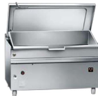
Superficie • surface 82 dmq

Sollevamento motorizzato + Accensione elettrica Motorised tilting + Electric ignition Automatische Kippung + Elektrisch zündsystem Soulèvement motorisé + Allumage électrique • Elevación automática + Encendido eléctrico